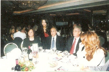
النائب خليل الهراوي وعقيلته

اعلنت جمعية «بسمة» التي تعنى بمساعدة المعوزين والمشردين عن انطلاق اعمالها في حفل عشاء اقيم في فندق ماريوت بيروت وحضرته شخصيات سياسية واجتماعية واعضاء الجمعية الانسانية.